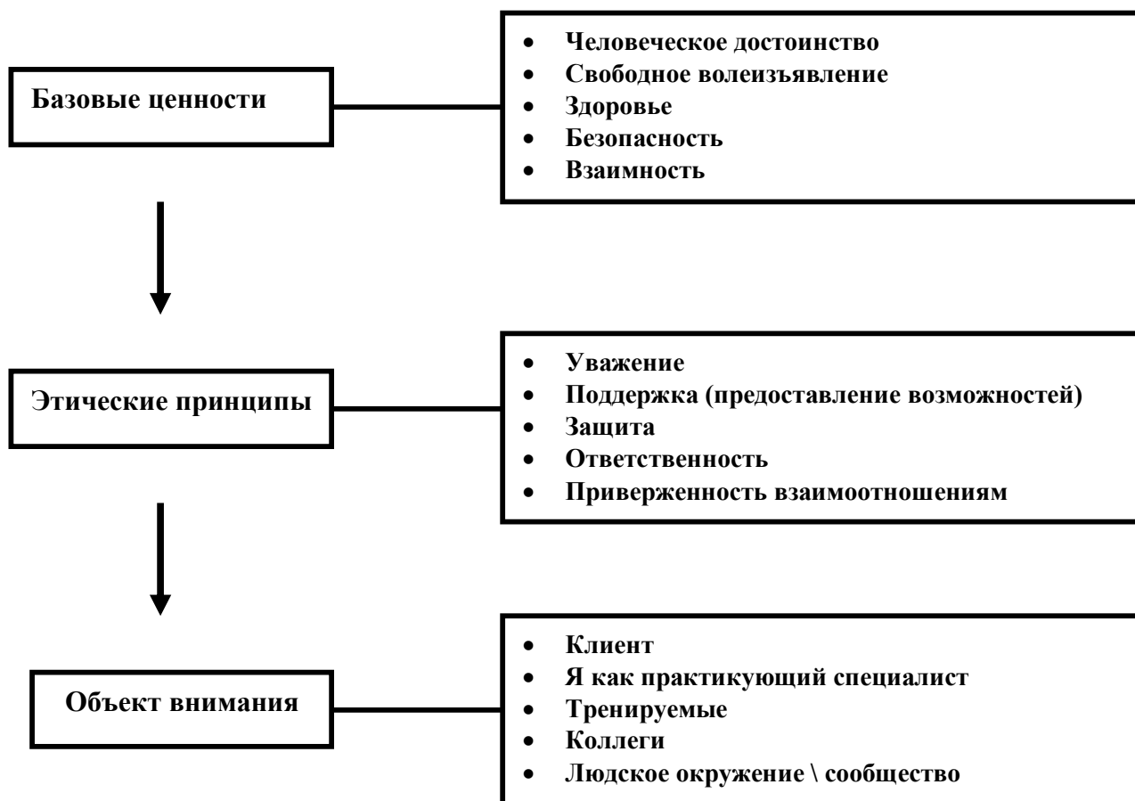
Рис. 1 Синтез основ этического кодекса: три уровня анализа деятельности с точки зрения этики.